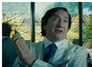
ANTONIO ALBANESE Qualunque 2011