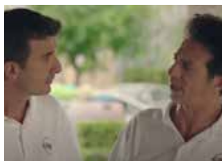
FICARRA E PICONE L'ora legale 2017