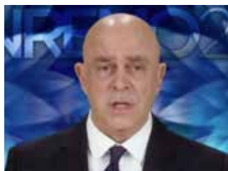
MAURIZIO CROZZA Festival di Sanremo 2017