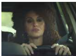
PAOLA CORTELLESI Ma cosa ci dice il cervello 2019